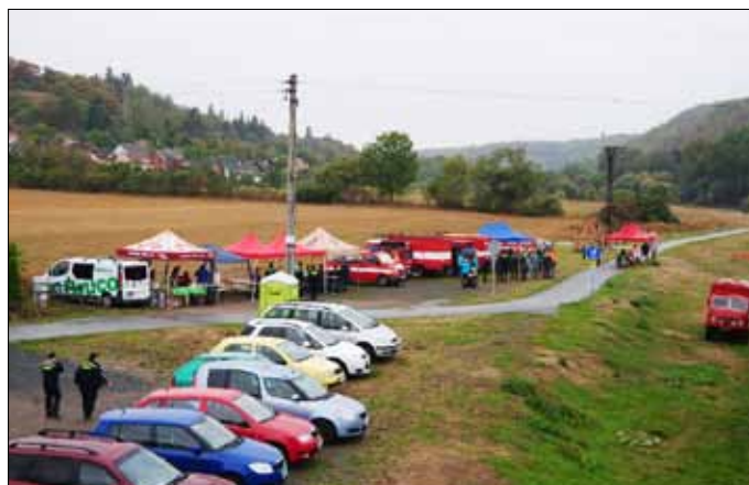
■ O putovní pohár na Berounce