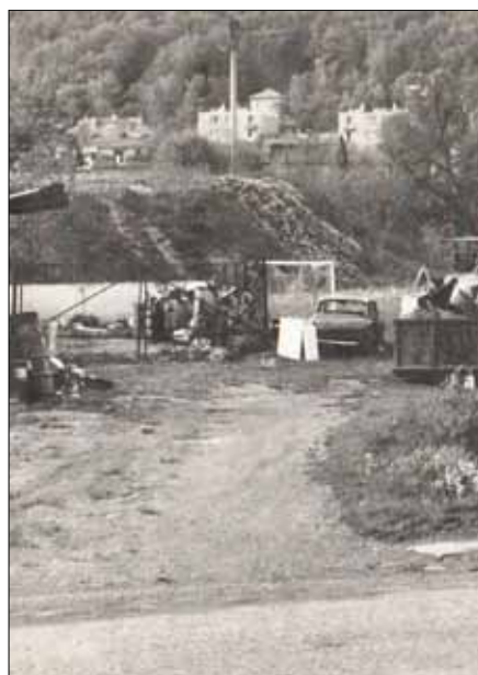
■ Louka pod benzínkou