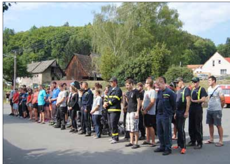
■ Žloukovické brodění – vítězné družstvo a slavnostní nástup