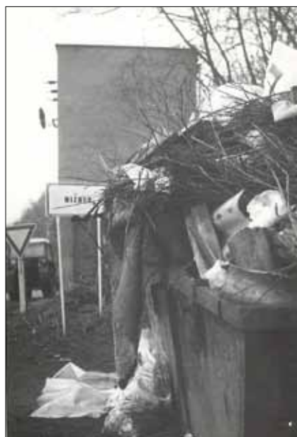
■ Křižovatka u trafa (směr Žloutkovice)