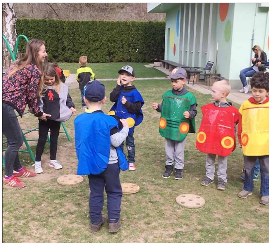
■ Autoškola – děti se v převlečení za autíčka a semaforey seznamují s dopravními předpisy.

Na rozloučení s předškoláky si děti ze třídy Soviček připravily divadelní představení O perníkové chaloupce. Dokázaly se naučit dlouhé texty a celé představení odehrály naprosto bravurně. V představení vystoupily