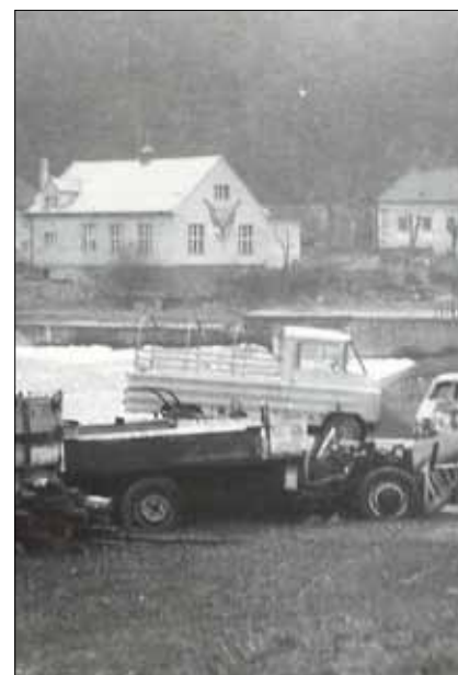
■ Na začátku obce směrem od Berouna