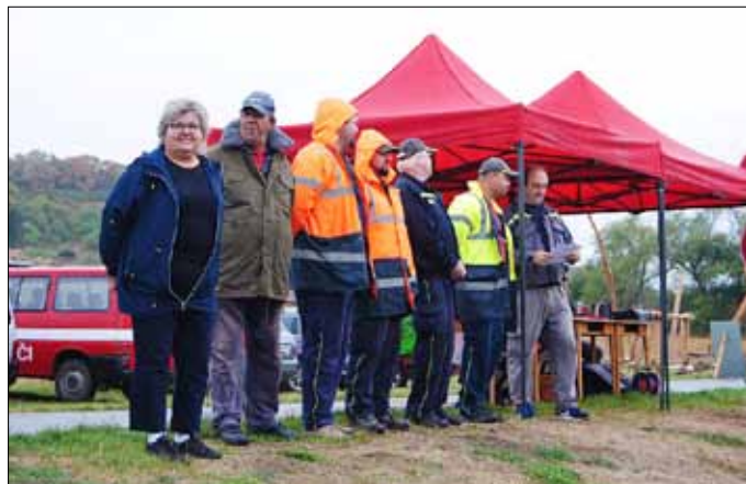
■ O putovní pohár na Berounce – zahájení