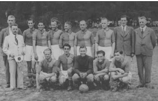
■ Otevření nového hřiště Za rybníky v roce 1942 utkáním s Bohemians Praha

Návštěvníci turnaje, kteří se sešli v hojném počtu, viděli spoustu hezkých branek, exhibiční utkání nižborských žáků a přes úmorné vedro výborné výkony jednotlivých mužstev. Memoriál se konal v rámci oslav 90 let fotbalu v Nižboru, které probíhají v letošním roce.