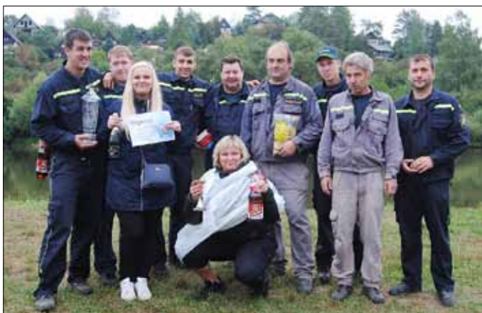
■ O putovní pohár na Berounce – vítězné družstvo