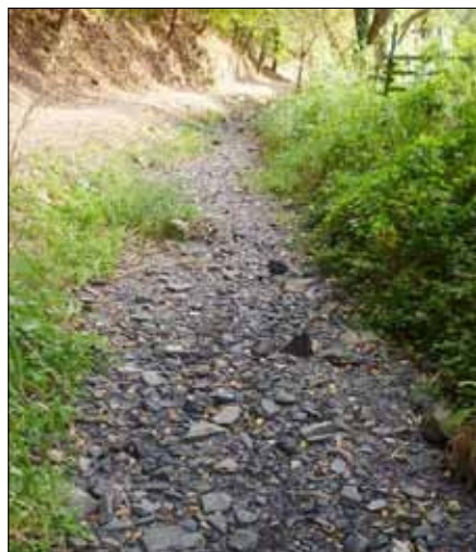
■ Letošní sucho se podepsalo i na Habrovém potoce, kde v jednom místě na čas úplně zmizela voda a koryto bylo úplně vyschlé.

Usnesení, zápisy a jeho přílohy jsou pravidelně zveřejňovány na webových stránkách obce: www.obecnizbor.cz , pod odkazem: menu → úřední deska → zastupitelstvo.