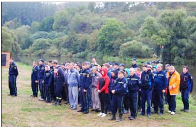
■ O putovní pohár na Berounce – nástup